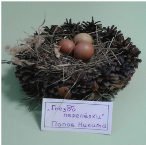
„Гнездо перепёлки“ Попов Никита